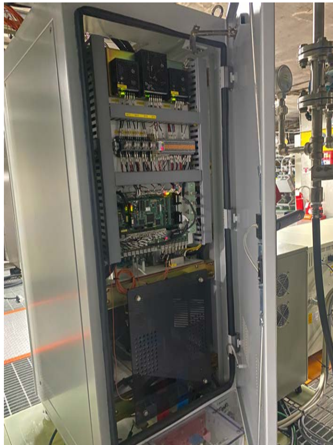
<그림 2. NBI Bending Magnet Power supply Rack 후면 전원 제어부>