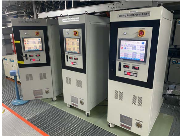
<그림 1. NBI Bending Magnet Power supply Rack>